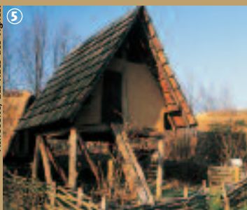
Achéosité, Les Rues-des-Vignes.

Ils vivaient dans de modestes maisons de bois et de torchis des poteries, objets en bronze et des tissus. L'archéosite des Rues des Vignes nous transporte à l'époque gallo-romaine à travers des reconstitutions et des vestiges authentiques comme la nécropole mérovingienne et la chapelle carolingienne.