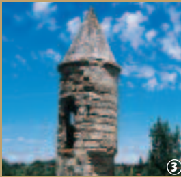
Echauguette, Les Rues-des-Vignes.

Cet édifice, fondé par Saint Bernard en 1132, est un exemple rare de l'art cistercien dans le Nord. Malheureusement, la Révolution Française et les guerres ont considérablement réduit cet ensemble qui comportait notamment l'église