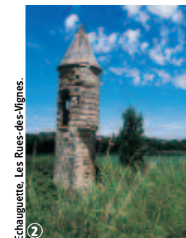
Echauguette, Les Rues-des-Vignes.