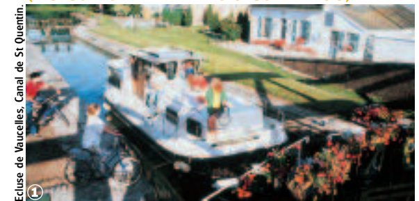
Ecluse de Vaucelles, Canal de St Quentin.

Une sélection des 30 plus belles balades