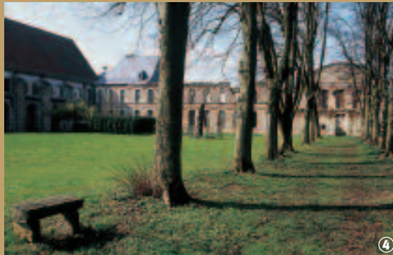
Abbaye de Vaucelles, Les Rues-des-Vignes.

cistercienne, la plus vaste d'Europe (plus grande encore que Notre-Dame-de-Paris) et qui fut démolie à la fin du XVIII e siècle, afin de pourvoir aux besoins en pierre.